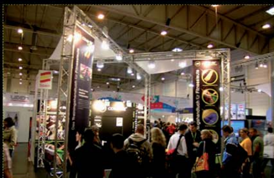
Stand de Cover-Fit en la Feria FIBO. Alemania, 2008