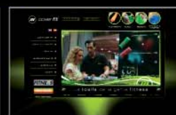
Estrategia de Venta que asegura tu éxito