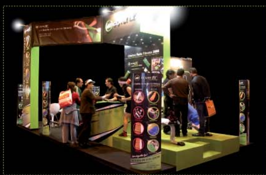
Stand de Cover-Fit en la Feria Fitness. Madrid, IFEMA, 2008